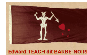
Edward TEACH dit BARBE-NOIRE

Argent/S. à 124 KM au nord du début de la route